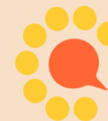
Table de Concertation Enfance - Famille - Jeunesse de l'Ouest-de-l'Île