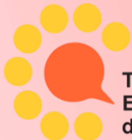
Table de Concertation Enfance - Famille - Jeunesse de l'Ouest-de-l'Île