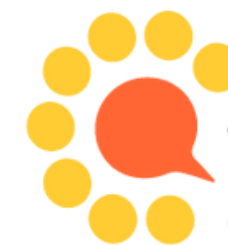
Table de Concertation Enfance - Famille - Jeunesse de l'Ouest-de-l'Île